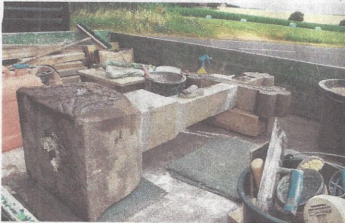
In Einzelteilen wird das Kreuz angeliefert.

Während der falsche Stein ausgewählt wurde, kam es zu tiefen Rissen von der Spitze bis zum Sockel